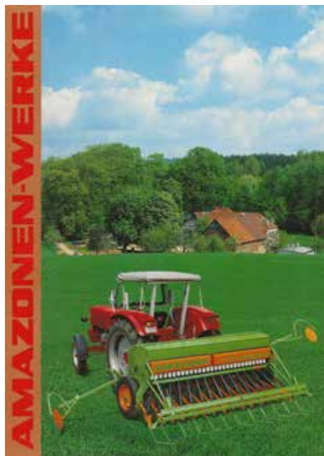
De Amazone D8 Super beschikte over een markeur schakelautomaat, die bij het heffen van de machine op de kopakker, de markeurarmen met schijven automatisch omschakelde.