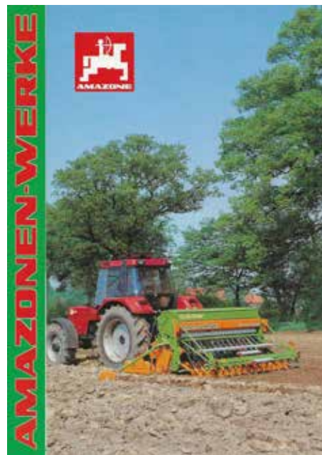
Met de introductie van de RPD DrillStar in 1988 bood Amazone de eerste bandenpakkerrol aan als alternatief voor de kooirol en de packerwals. De bandenpakkerrol zorgde voor een strooksgewijze verdichting van de grond.