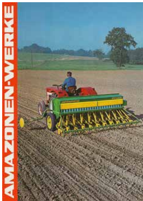
De D7 groeide uit tot één van de best verkochte zaaimachines van zijn tijd en stond model voor de latere D8-serie.