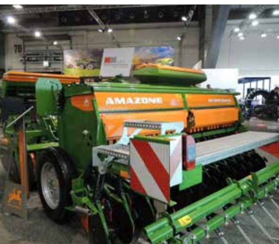
De D9 die in 1999 werd geïntroduceerd is nog altijd in productie.

Amazone D4-zaaimachines de fabriek te Hude (Oldenburg) die in 1957 speciaal was opgericht voor de productie van zaaimachines en stalmeststrooiers.